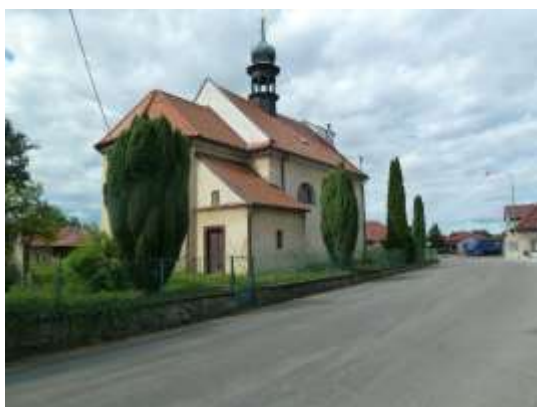
Kostel sv. Jiljí

Na území obce je evidován objekt zapsaný ve státním seznamu nemovitých kulturních památek: