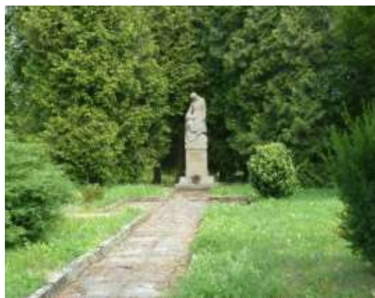
Pomník obětem I.sv.

Řešené území je územím s archeologickými nálezy (ÚAN) podle památkového zákona. Má-li se provádět stavební činnost na území s archeologickými nálezy, jsou stavebníci již od doby přípravy stavby povinni tento záměr oznámit Archeologickému ústavu a umožnit jemu nebo oprávněné organizaci provést na dotčeném území záchranný archeologický výzkum. O archeologickém nález, který nebyl učiněn při provádění archeologických výzkumů, musí být učiněno oznámení Archeologickému ústavu nebo nejbližšímu muzeu buď přímo, nebo prostřednictvím obce, v jejímž územním obvodu k archeologickému nález došlo.